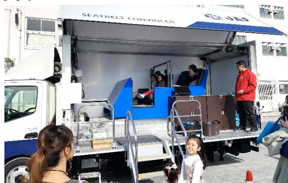
交通安全シミュレーターが来た(2019年)

県警交通安全教育隊による幼児から年配の方までの「歩き方、自転車、オートバイ教室」、あるいは都筑警察署による小学生向けの「チリンスクール」を企画しています。