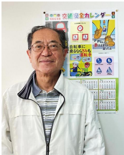
宮内第6代町内会長です

でした。2022年現在は人口4,426人(男性2,149人、女性2,277人)、平均年齢46.3歳と大きく変わっています。平均年齢が比較的若い都筑区にあって、高齢化率24.6%と全国平均並みに高