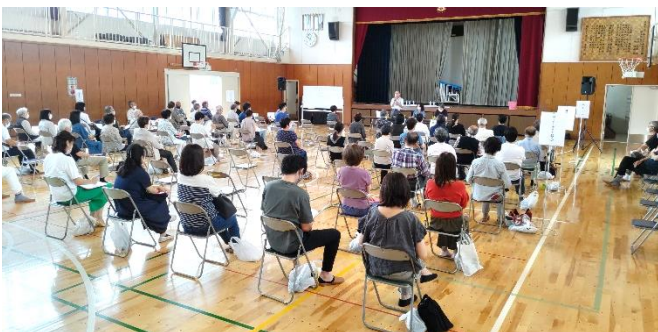
2022 年度第 1 回組長会

コロナの影響で 2 年間開催されなかった組長会がすみれ小体育館（従来は会館で実施）で 6 月 12 日（日）に開催されました。58 名の組長さんに出席いただき、組長さんのお仕事の説明、質疑応答などを行いました。質疑の結果は Q&A にまとめて町内会ホームページの「組長さんへ」のページに掲載してあります。