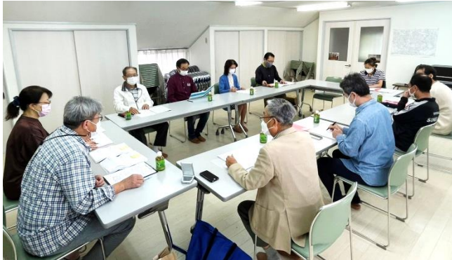
2022 年度総会（書面表決で実施）

2022 年度総会は、2021 年度に続き書面表決にて 4 月 24 日（日）に実施されました。予算及び事業計画、会長含む新役員人事については、原案通り承認されました。コロナ禍は続いています、概ね 2019 年度に近い事業計画となっています（行事予定を参照）。