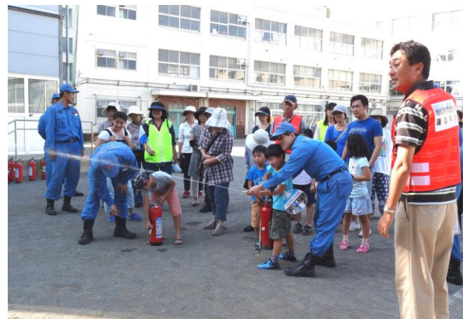
水消火器を使ってみよう！

災害はいつどんな形で襲ってくるかわかりません。各家庭で常に万が一に備えましょう。町内会でも当日の反省も踏まえ、よりよい防災訓練プログラムを今後も考えてまいります。