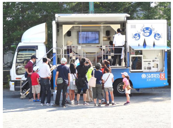
起震車で震度7を経験！

町内会加入促進キャンペーン中です！お近くに未加入の方がおられたら、ぜひ加入をお勧めください！