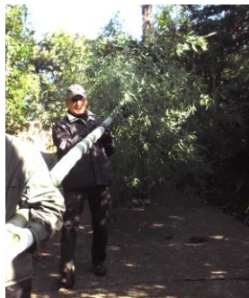
どんど焼きの竹伐りに参加しました！

今年はいくつかの活動に加え、自助（自分と家族を守る）・共助（近隣や町内会での助け合い）の確保のための対策を検討・実施したいと考えています。