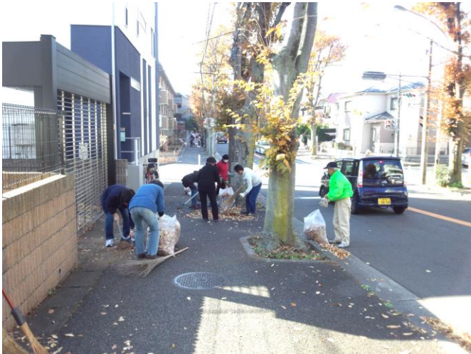
けやき通りがきれいになりました!

環境衛生部会では、ゴミ出しルールについて守って頂くため、チラシを配布するなどして皆様にご協力をお願いして来ましたが、おかげさまでだいぶ解決に向かっております。皆様にはゴミ問題についてのご理解をより一層深めて頂きたいと考えています。また、町内環境の整備を進めるため、皆様からご意見等を頂ければと思います(ご意見送付先(Eメール): info@sumiregaoka.com)。頂いたご意見を参考に2014年のゴミ問題の解決のための目標を定め、一層の努力、活動を進めますので、皆様のご協力をお願い致します。