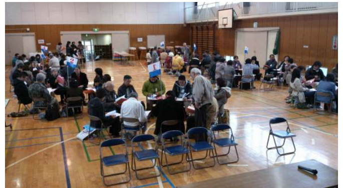
ブロックごとに今年の担当を話し合いました

来年の総会までの 1 年間、新組長さんにはいろいろご負担をお掛けしますが、どうかよろしくお願ひします。