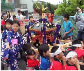
子ども神輿（みこし）